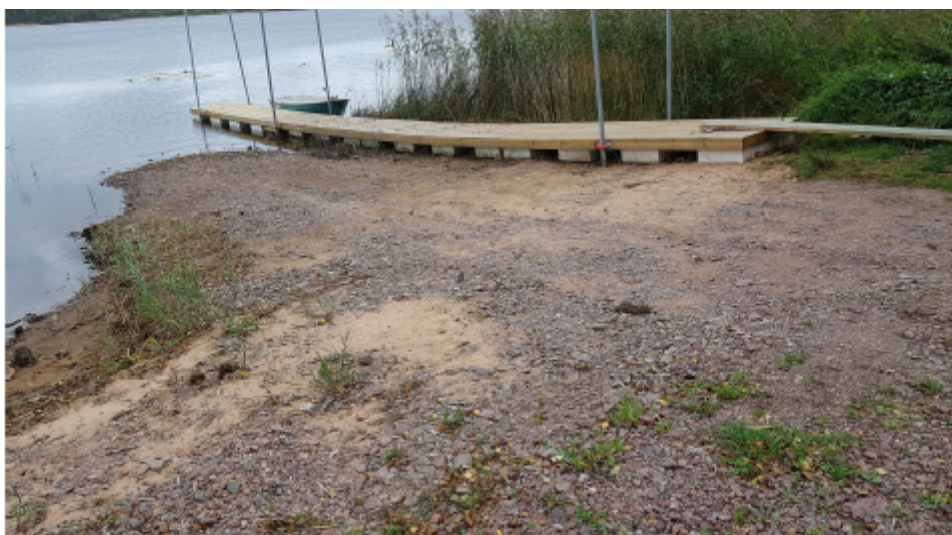
Fotografi på vattennivån i Hulingen